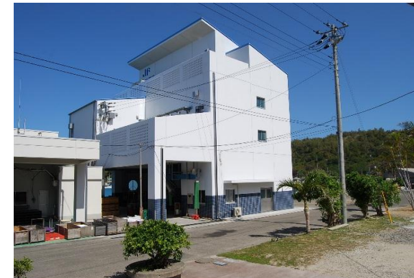
東京都/ 製氷施設(小笠原島漁業協同組合) (H21)