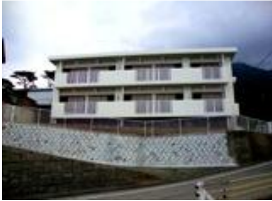
御蔵島村/ 御蔵島かんぶり515住宅新築設計 (H20)