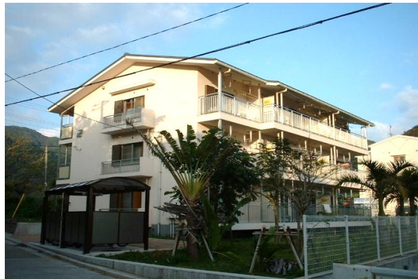
東京都東部住宅建設事務所/ 都営小笠原沖村団地建物設計(その2) (H17)