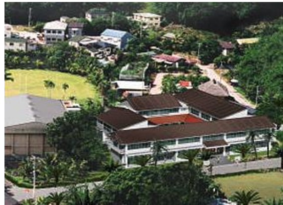
小笠原村/ 母島小中学校改築実施設計 (H14)