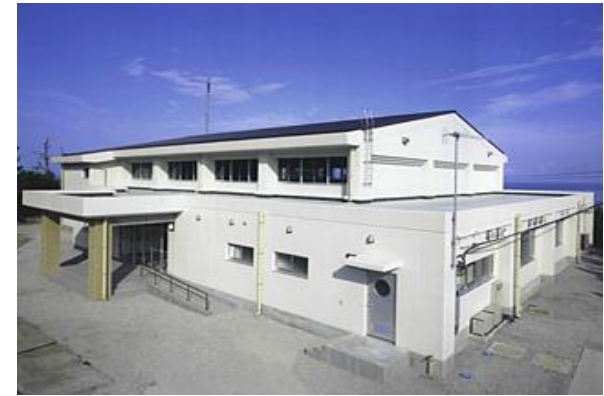
三宅村/ 三宅村コミュニティセンター建設工事実施設計 (H18)